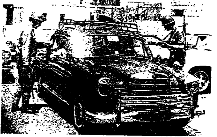
دورية من الشرطة تنفق بالهويوت في بيروت